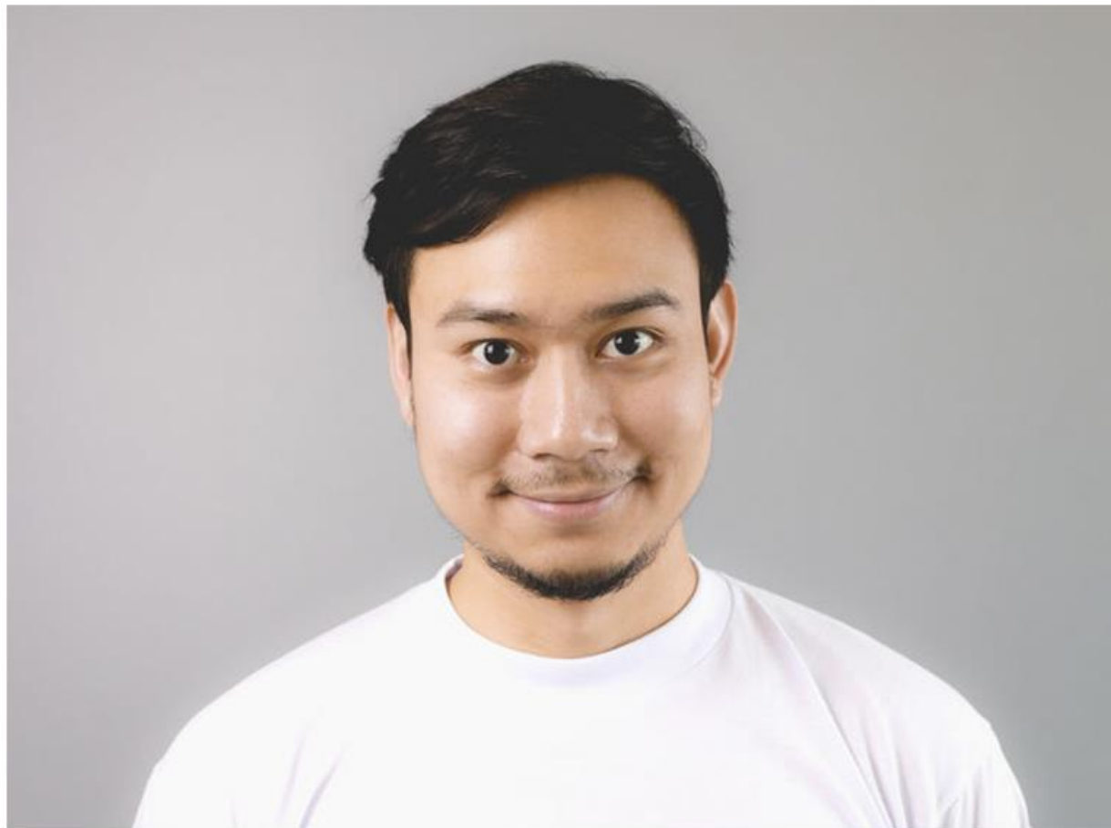
Фото сделано, отправляем?